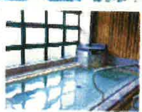
前名の湯 (杉ノ原温泉) TEL: 0250-86-6001 【営業時間】10:00～20:00(12月～3月) 【料金】大人1,000円(税込) 【予約】0250-86-6001 ※12月～3月のみ営業。4月～9月は休業。 ※入浴料は別途。お風呂の湯は、お湯の湯。

New! 「Gondola Line」新設! ケーブル、パンク、スライムなど3.5kmの スロープアクター・ビジュアルが杉ノ原ゾーンに誕生!